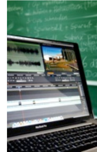
Grafik- und Schnittplätze Gestaltung für AV-Medien

Bei bestandener FHR-Prüfung in Verbindung mit einem halbjährigen Praktikum oder zweijähriger Berufstätigkeit wird die „Fachhochschulreife“ erworben.