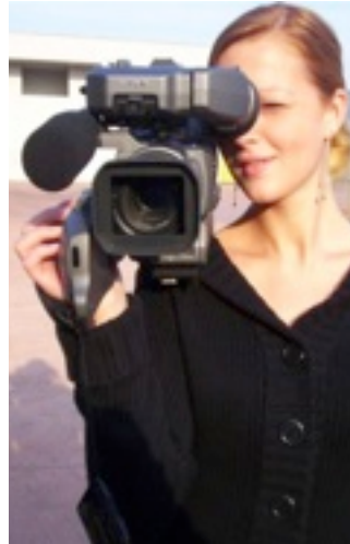
Videoproduktion Selbständiges Arbeiten

Die genannten beruflichen Handlungsfelder beschreiben den Anspruch an die Fachkompetenz. Darüber hinaus lernen die Schüler die folgenden Schlüsselqualifikationen :