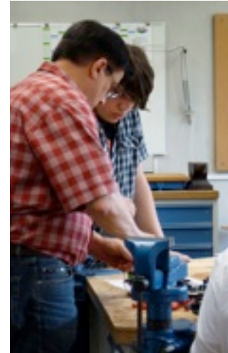
Werkstatttraum Praktische technische Vermittlung

Eine weitere wichtige Säule dieser Ausbildung stellt der berufsübergreifende Bereich dar. Hier werden die Kenntnisse für die Erlangung der Studierfähigkeit und damit die Fachhochschulreife vermittelt.